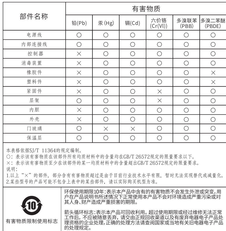
有害物质的名称和含量表

以上标识均依据中国有害物质限制使用管理办法及其配套标准SJ/T 11364要求执行。 本产品长期使用不会对人体产生危害, 请放心使用。