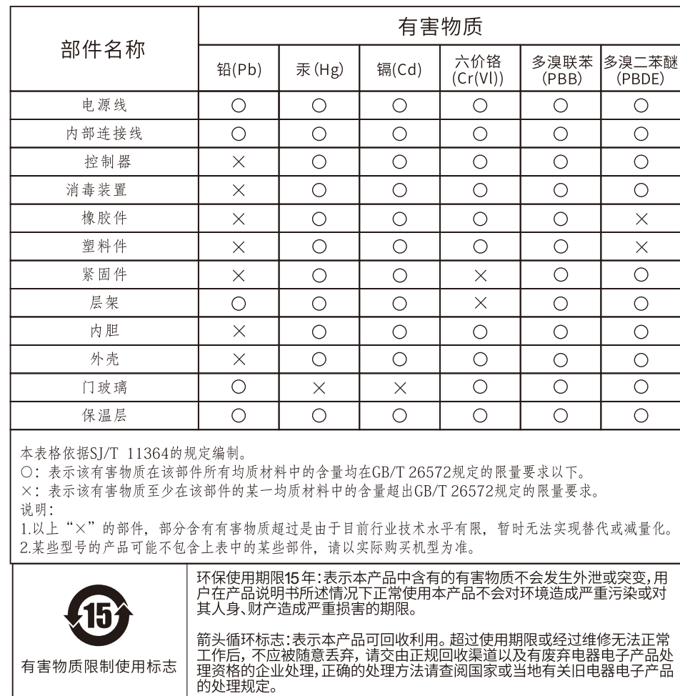
有害物质的名称和含量表

以上标识均依据中国有害物质限制使用管理办法及其配套标准SJ/T 11364要求执行。 本产品长期使用不会对人体产生危害, 请放心使用。